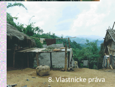
8. Vlastnícke práva