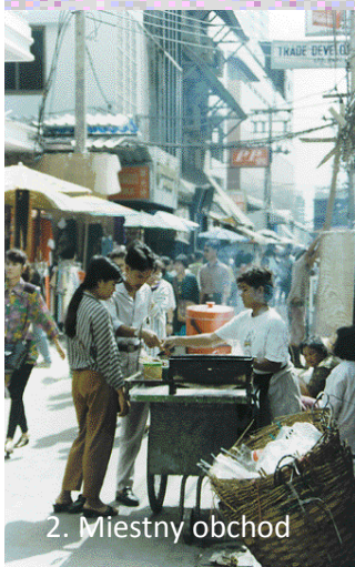
2. Miestny obchod