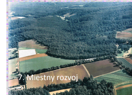
7. Miestny rozvoj