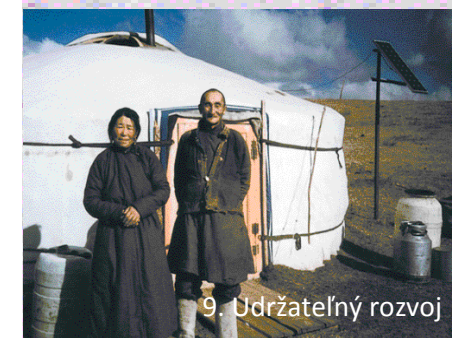
9. Udržateľný rozvoj