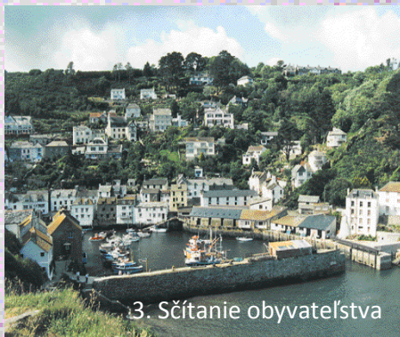
3. Sčítanie obyvateľstva