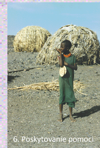
6. Poskytovanie pomoci