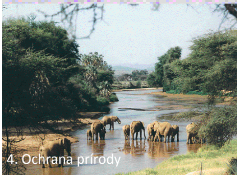
4. Ochrana prírody