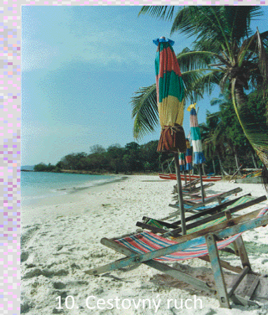
10. Cestovný ruch